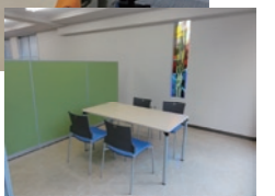
応接打ち合わせコーナー

暗く、老朽化した1階の事務室内装を全面リニューアル。同時に照明・空調設備を高効率化。