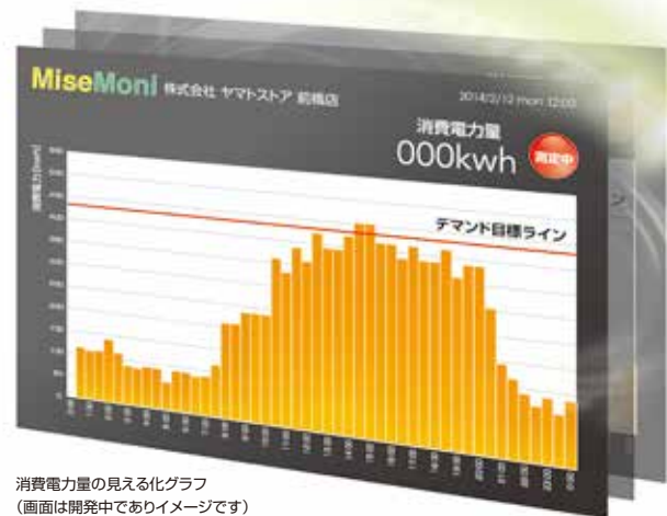
消費電力量の見える化グラフ (画面は開発中でありイメージです)

■ 計測機器：当社で準備(初期投資については協議必要)、1年間無償貸与 ■ 点検作業、報告作成業務：保証期間中の業務として無償で実施