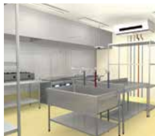
バックヤード(惣菜)