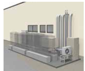
排熱回収ユニット